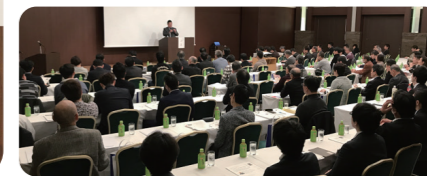
2019年1月19日セミナー会場