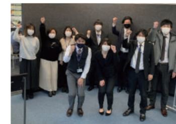
大学前店 2021年繁盛期スタート!

今年のアパマンショップ富山大学前店は、新記録更新が相次ぎ活況でした！コロナ禍での繁盛期に突入し、学生さんのお部屋探しの動きが心配でした。ところが、2月25日、前期試験当日来店のお部屋探しのお客さまの数が、過去最高の128組を数えました。インターネットによる情報公開の質を飛躍的に高めた効果でした。前日の24日が、44組の来店でしたので、2日間で172組もお客さまに来店をいただきました。ありがたい限りです。当日は、 コロナ感染に万全を期し、発券機による整理券の発行、順番がくるとスマホにコールするというシステムも導入 、お待ちのお客さまの密に、特に対策を講じました。さらには、合格前予約をいただきました受験生のみなさまの合格率も、本年は61.2%と新記録を達成。お部屋の予約をした受験生の方の合格率がとても高い結果に、大喜びです。