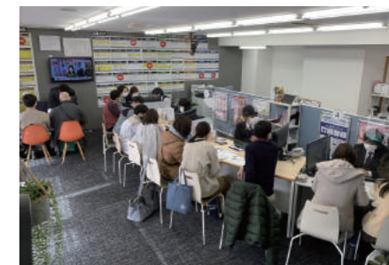
にぎわう富山大学前店