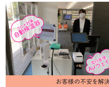
お客様の不安を解決

今年の特徴は、来店せず、事前にインターネットの空室情報で、お部屋を予約される方の人数が増えました。オンライン、非接触によるお部屋探し、契約に関するオンラインでの手続きなど、お客さまの不安を解決する取り組みの強化の必要性を実感しています。