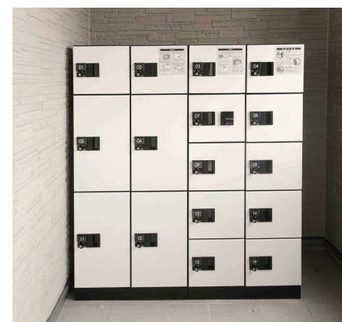
▲プリズムとなみ若草町に設置してある宅配ボックス

さて、賃貸物件の人気設備といえば1位「インターネット月額無料」、2位「オートロック」、3位「追い焚き機能」などですが、最近では「 宅配ボックス 」が非常に人気があり、ランキングも急上昇しています。ネット通販が盛んなのは以前からですが、賃貸物件の設備にするには高額なためか付いている物件は少なく、高級マンションにしかありませんでした。最近では安価な宅配ボックスも出回り、流行や動向に敏感なオーナー様はすでに取り入れられています。新築物件も増える中、他との差別化を図り入居促進に繋げましょう。