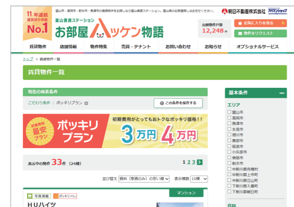
▲弊社サイト「お部屋ハッケン物語」でも大々的に取り上げているポッキリプラン。絞り込み検索にも項目があり、お客様の目にもとりやすくなっています。